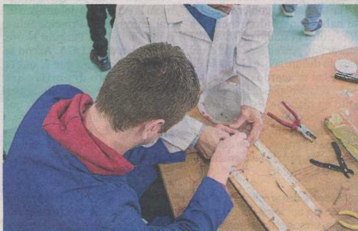
El curso acredita para trabajar como formador para el empleo. PIA

El curso está financiado por el Fondo Social Europeo como respuesta a la pandemia.