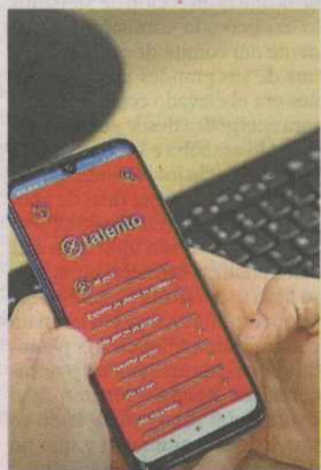
La campaña cuenta con un vídeo.

Inserta Empleo, la entidad de Fundación ONCE para la formación y el empleo, acaba de lanzar 'El mundo te necesita', ( www.elmundotenecestitaya.es ), una iniciativa 'online' que tiene como objetivo animar a los jóvenes con discapacidad a seguir formándose y a romper los frenos y prejuicios que puedan tener para ponerse en búsqueda activa de empleo. Esta campaña supone el arranque del programa Alianzas con el Talento con el que Fundación ONCE e Inserta ofrecen a jóvenes que terminan la educación obligatoria un acompañamiento