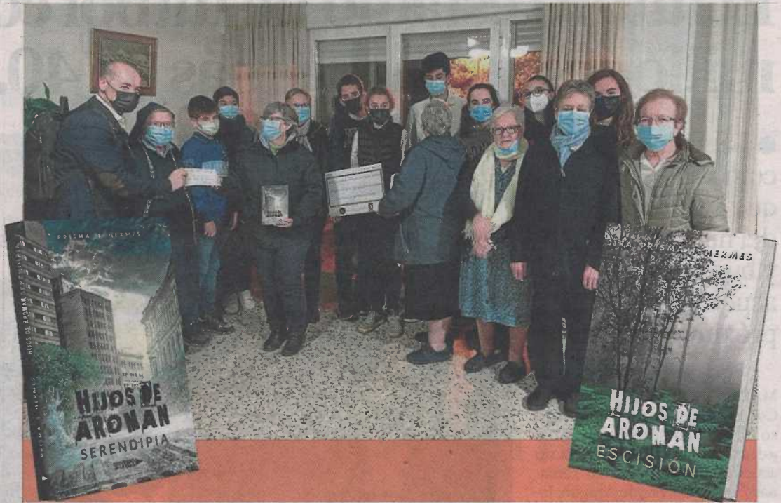
Miembros del Club de lectura juvenil, junto a las Hijas de la Caridad en 'Las Casitas'.

Con esta acción colaborativa, el grupo de jóvenes culminaba un año ilusionante, un maravilloso sueño hecho realidad, tras realizar diferentes actos comunicacionales para dar difusión al propio club y a su primera obra, 'Serendipia': presentaciones, entrevistas en radio, declaraciones y notas de prensa en periódicos regionales y firmas de ejemplares en las principales librerías de la ciudad. La novela puede adquirirse en librerías y