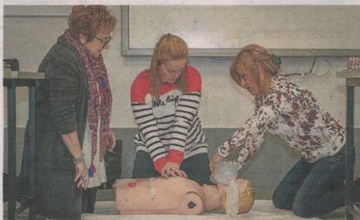
Práctica en un taller de formación sanitaria de Fundación DFA. DFA

El programa 'DFA Inserta' cerró el año 2021 con una cifra muy positiva: de los 335 usuarios y usuarias con discapacidad que recibieron atención en las tres provincias aragonesas, 96 consiguieron un trabajo. Zaragoza se convirtió en la provincia donde el porcentaje de